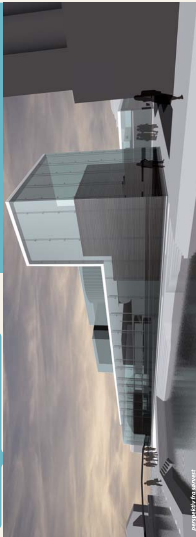
perspektiv fra sørvest

Parkeringshuset er på 2 etasjer pluss takflate, og vil romme 400 p- plasser. Takflaten er gitt form som en slags parkeringspark. Takflaten som rom gis en presis definisjon av bratt terreng på tre kanter og bygningen, som har moderate volumer. Tre arkutslager i overgangen mellom bygg og terreng setter stemningen, sammen med spredte, futuristiske Furueie, med sin karakteristiske stamme og lyse preg gir et utradisjonelt, naturligt og mykt preg på en i utgangspunktet stor stram flate. Nettopp kontrasten mellom det presist definte rommet og furuens forandrelige preg og spredte plassering er med på å tilføre rommet spenning.